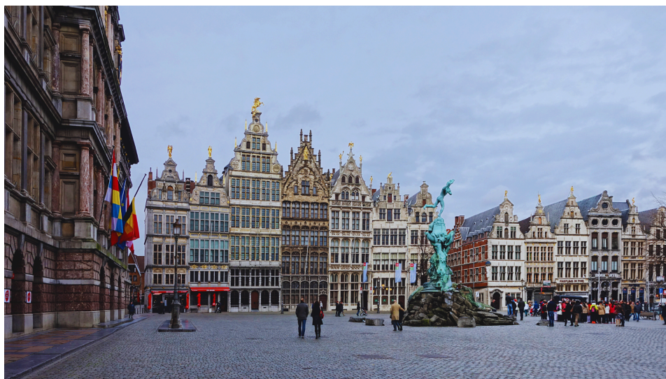
5. Grand Place