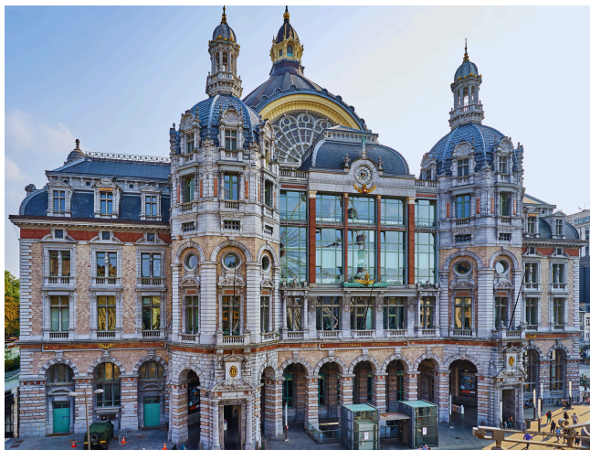
1. Gare centrale

Deuxième plus grande ville de Belgique, ville portuaire, plaque tournante du commerce du diamant, berceau du plus ancien club de football belge, gardienne d'un charme propre aux cités flamandes, Anvers n'a cessé de se développer pour être aujourd'hui une ville où le traditionnel, le pittoresque et le moderne vivent ensemble. Découvrez quelques lieux emblématiques de la ville au cours de cette journée et plus spécifiquement durant la balade touristique de ce matin :