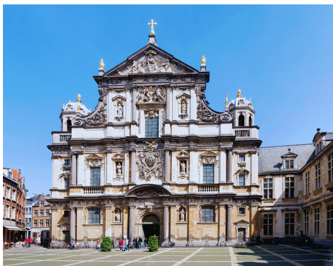
3. Saint-Charles Borromée