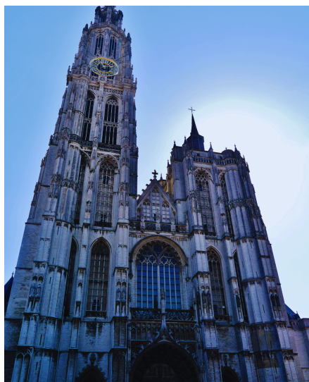
4. Cathédrale Notre-Dame