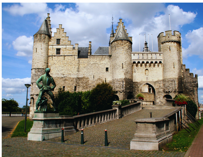
6. Het Steen