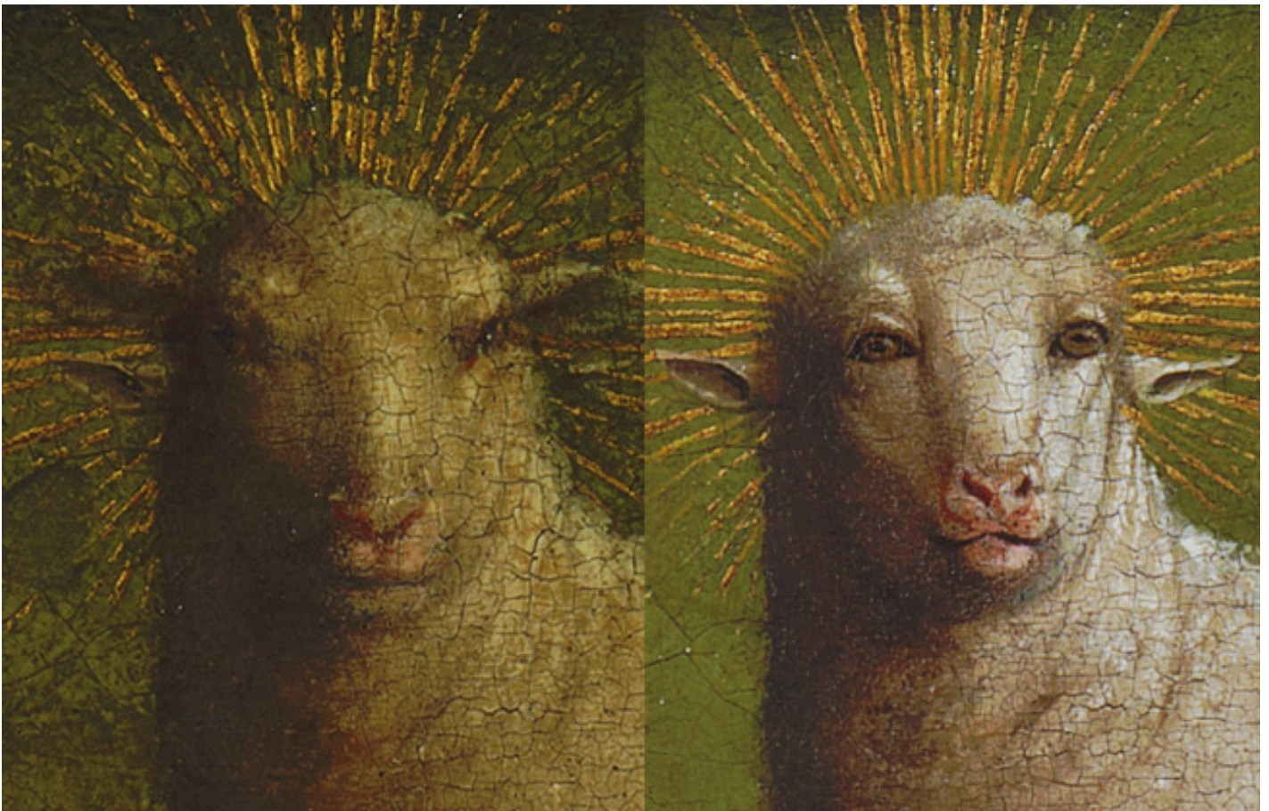
Exemple d'avant/après restauration www.closetovaneyck.kikirpa.be

L'un des meilleurs exemples et l'un des projets phares de l'IRPA, est la restauration de l'Agneau mystique , chef-d'œuvre des frères Van Eyck. La restauration - toujours en cours - de ce polyptique s'est faite en plusieurs phases. Entre 2012 et 2016, ce sont les panneaux extérieurs qui ont connu un nouveau souffle. Ensuite, de 2016 à 2019, les panneaux du registre inférieur, comprenant notamment la scène représentant l'Agneau, ont été traités pour retrouver les couleurs vives et les détails fins et ainsi, offrir une meilleure appréciation du travail des frères Van Eyck. La troisième et dernière phase (2023-2026) porte sur les sept panneaux du registre supérieur du retable ouvert. Cette restauration est encore aujourd'hui publique puisqu'un atelier vitré a été aménagé dans une salle du musée des Beaux-Arts de Gand. Chaque visiteur peut dès lors observer le travail minutieux des restaurateurs et restauratrices en direct.